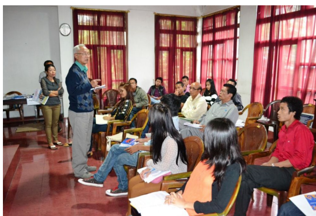
Sharing session with elders.

Before the training, all the selected participants were given an assignment of pre-assessment training which is very important for designing the program and understanding their level of understanding and expectation. At the end of the day, each participant was given a daily feedback form. This feedback is also important for the organiser and the resource persons to