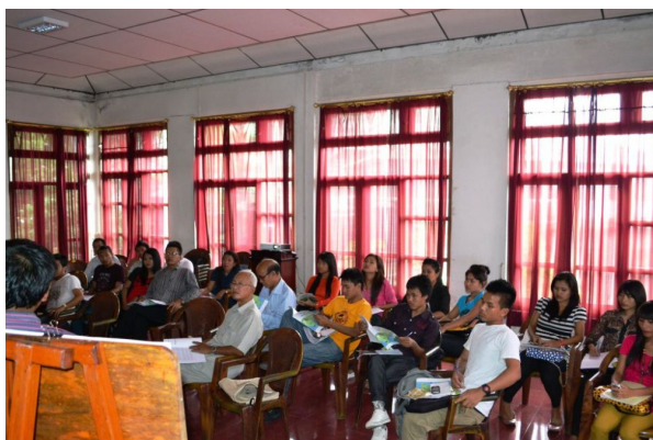
Session of the in-house training.

The Raltes zealously maintained their individual identity and resisted absorption into the folds of the Lushais or Mizo. As of today, most Ralte clans do not specify their tribe and carry on with their tribe name Ralte (mostly using Mizo tawng), and the languages are still used by a few people, even if some of their community members can't understand and speak these languages.